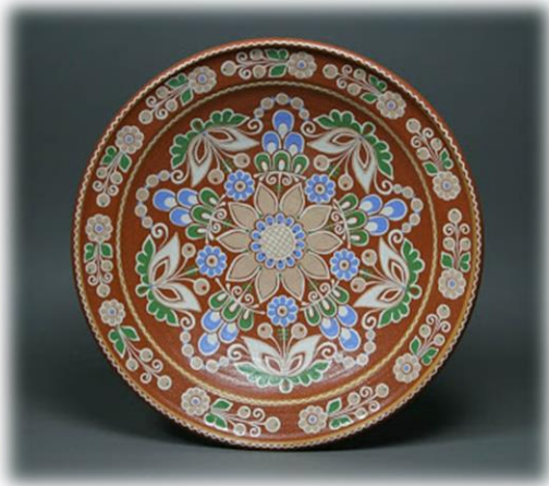
Українська національна кераміка

Отже, завдяки сусідству між Україною та Польшею в культурах цих країн дуже багато спільного, особливо точно це передає гончарство. Це виражається в формі, кольорі, техніках. Навіть те, що здавалось би належить кожній країні окремо можна поєднати в одне ціле, – так як це зробили з петриківським розписом і орнаментом болеславської кераміки. Оскільки стільки звичаїв дійшло до сьогодення можна сказати, що гончарство не має часових кордонів і залишається актуальним до нашого часу.