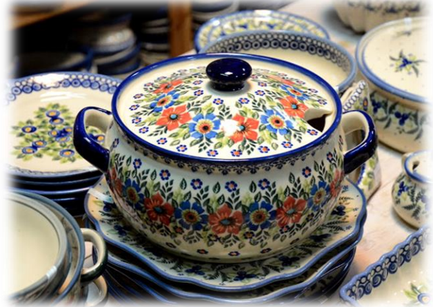
Польська національна кераміка