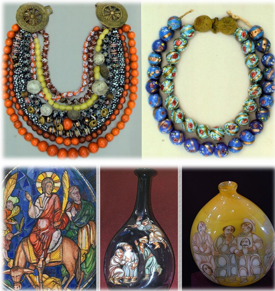
Традиційні українські вироби зі скла

Традиції виготовлення художнього скла зберігаються й донині у кількох містах України, зокрема в Києві та Львові. Гутництво продовжує існувати як один з видів народного декоративно-прикладного мистецтва.