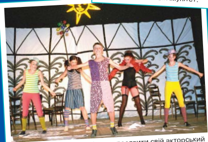
Кожен студент УДХТУ може проявити свій акторський хист. Уже вісім років студентський театр «В движении» радує глядачів новими виставами.

СЛОВО ХІМІКА Газета ДВНЗ «Український державний хіміко-технологічний університет»