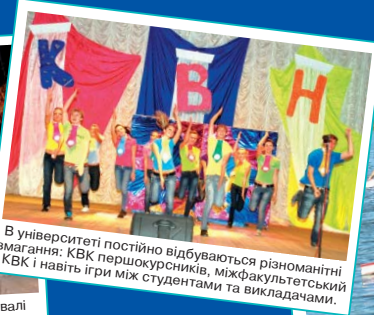
В університеті постійно відбуваються різноманітні змагання: КВК першокурсників, міжфакультетський КВК і навіть ігри між студентами та викладачами.