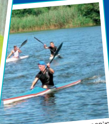
УДХТУ приділяє значну увагу здоров'ю своїх студентів, тому в університеті створено умови для занять фізичною культурою та спортом: кімнати з тренажерами у кожному гуртожитку, сучасний спортивний комплекс з трьома залами – найкращий в Україні, водна станція на Дніпрі.