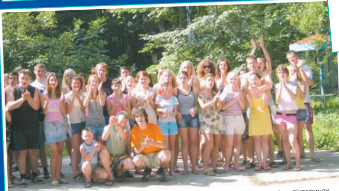
Студенти УДХТУ можуть відпочити, відновити сили, взяти участь у конкурсах, вікторинах, вечорах самодіяльності у спортивно-оздоровчому таборі «Дубовий гай», розташованому в мальовничому місці – в Орловщині на річці Самара.