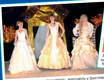
Хіміхівці співають, танцюють, жартують у фестивалі «Студентська весна» та конкурсі «Зимова красуня»

Воно набагато цікавіше та різноманітніше. Український державний хіміко-технологічний університет завжди славився своїм прагненням розкрити творчий потенціал кожного студента