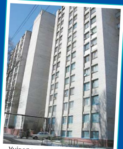
Університет має п'ять гуртожитків, а також санаторій-профлакторій, де кожен студент може зміцнити свій імунітет.